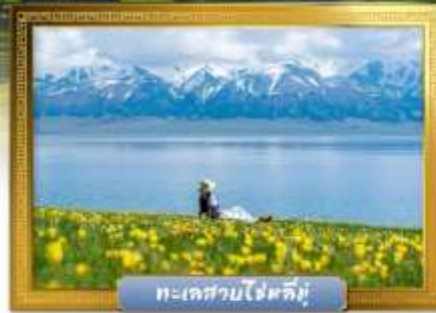
ทะเลสาบไซหลิมู่