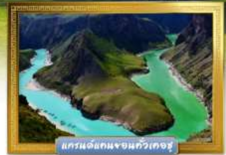
แกรนด์แคนยอนจอนกัวเคอซู

เดินทางโดย : สายการบินโซนาเซาเทิร์นแอร์ไลน์