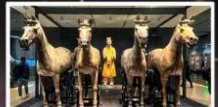
สุสานทหารจีนซี