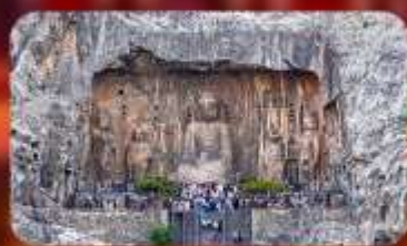
กำแพงหลงเหมิน