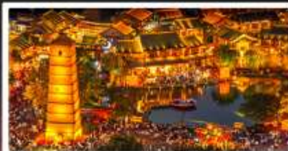
เมืองโบราณลั่วอี้