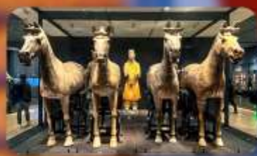
สุสานทหารจิ้นซี