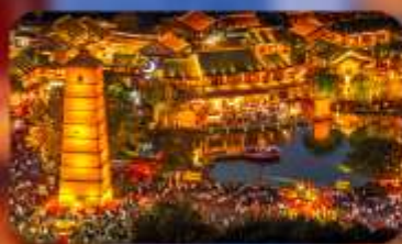
เมืองโบราณลั่วอี้