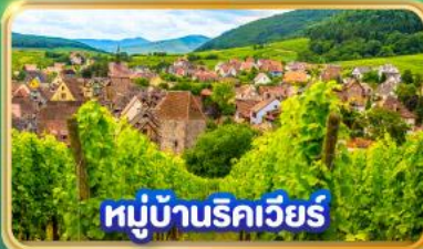
หมู่บ้านริควีร์