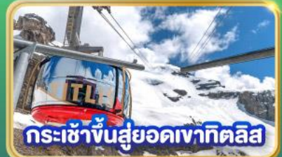
กระเช้าขึ้นสู่ยอดเขาทิตลิส

พิเศษ! ซอปปิ้งเต็มอัม ณ โรมอนด์ เอาท์เล็ต