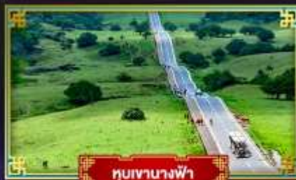
ทิวเขาบางฟ้า