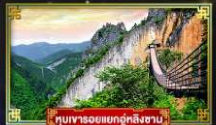
ทิวเขารอยแยกอุ๋ตลิ่งซาบ