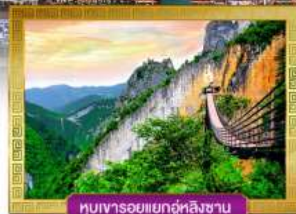
หุบเขารอยแยกอู่หลิงซาน